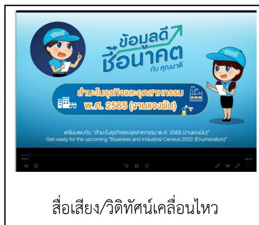
สื่อเสียง/วิดีโอทัศน์เคลื่อนไหว