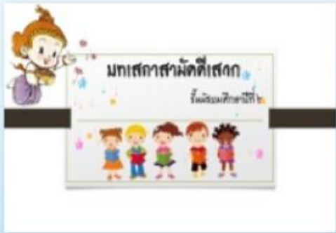
มหัศจรรย์สามัคคีเสวก

เพื่อให้ครูมีความรู้ความเข้าใจและมีความสามารถในการเลือกสร้าง หรือพัฒนาสื่อ นวัตกรรม เทคโนโลยี และแหล่งเรียนรู้ มาใช้ในการจัดการเรียนการสอนที่สอดคล้องกับแผนการจัดการเรียนรู้