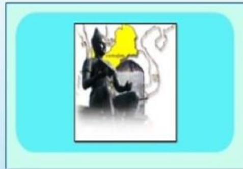
ศิลาจารึกหลักที่ ๑