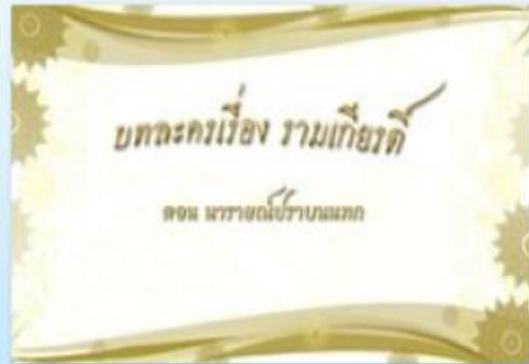
รามเกียรติ์-ตอน-นารายณ์ไปรามนหนก