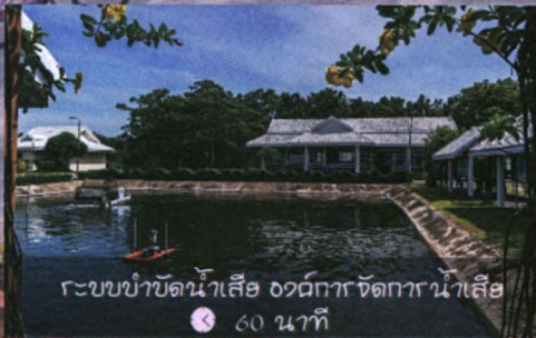
ระบบบำบัดน้ำเสีย องค์กรจัดการน้ำเสีย 🕒 60 นาที