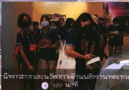
นิทรรศการและนวัตกรรมด้านพลังงานทดแทน 🕒 120 นาที