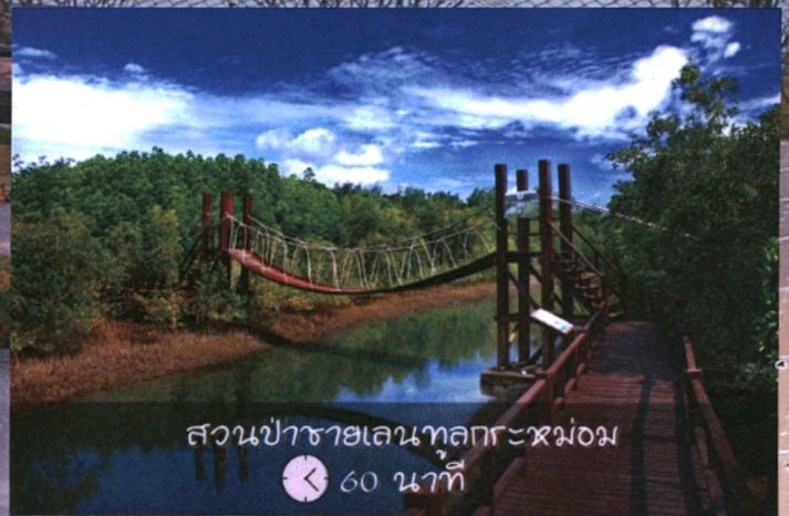
สวนป่าชายเลนทูลกระหม่อม 🕒 60 นาที