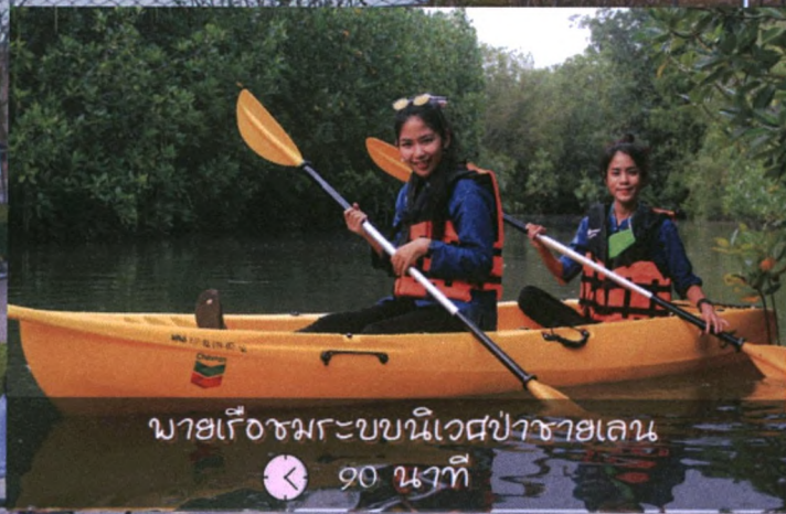
พายเรือชมระบบนิเวศป่าชายเลน 🕒 90 นาที