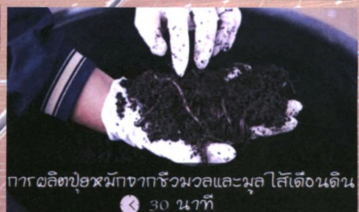
การผลิตปุ๋ยหมักจากจิวมวอลและมูลไส้เดือนดิน 🕒 30 นาที

หมายเหตุ : รวม 5 กิจกรรม ใช้เวลาโดยเฉลี่ยไม่เกิน 5 ชั่วโมงครึ่ง สามารถเลือกกิจกรรมได้ตามความเหมาะสม