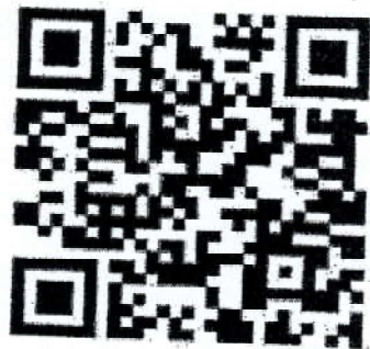
รายละเอียดกิจกรรม