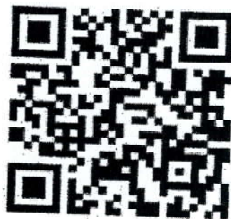
คุณสมบัติการคัดเลือก