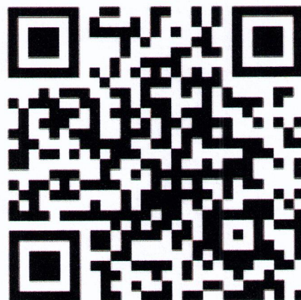
ลงทะเบียนเข้าร่วมอบรม